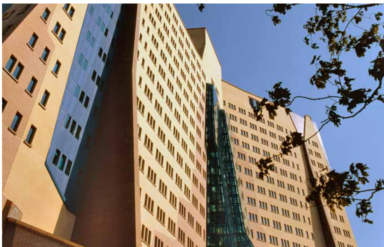
Het kantoor van de Gasunie in Groningen.