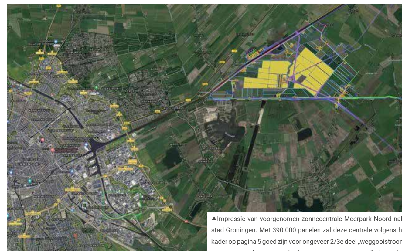
◀ Windturbines in Eemshavengebied

De oorspronkelijke opgave aan de 30 regio's was om 35 TWh per jaar op te wekken uit wind en zon. Die doelstelling was ontleend aan het Klimaatakkoord.