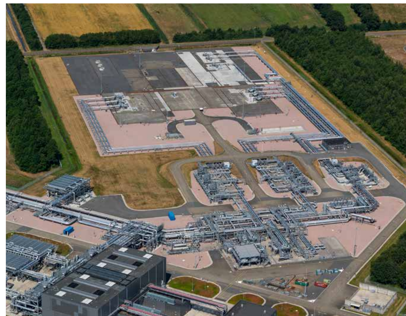
Ondergrondse gasopslag van de NAM in Langelo. Waterstof en de bijbehorende waterstofopslag is in de RES 1.0 niet uitgewerkt. In het kader op bladzijde 5 worden de bezwaarlijk grote energieverliezen genoemd. En de afhankelijkheid van fossiel voor het stroomnet, waarvoor aardgas bij uitstek geschikt is.