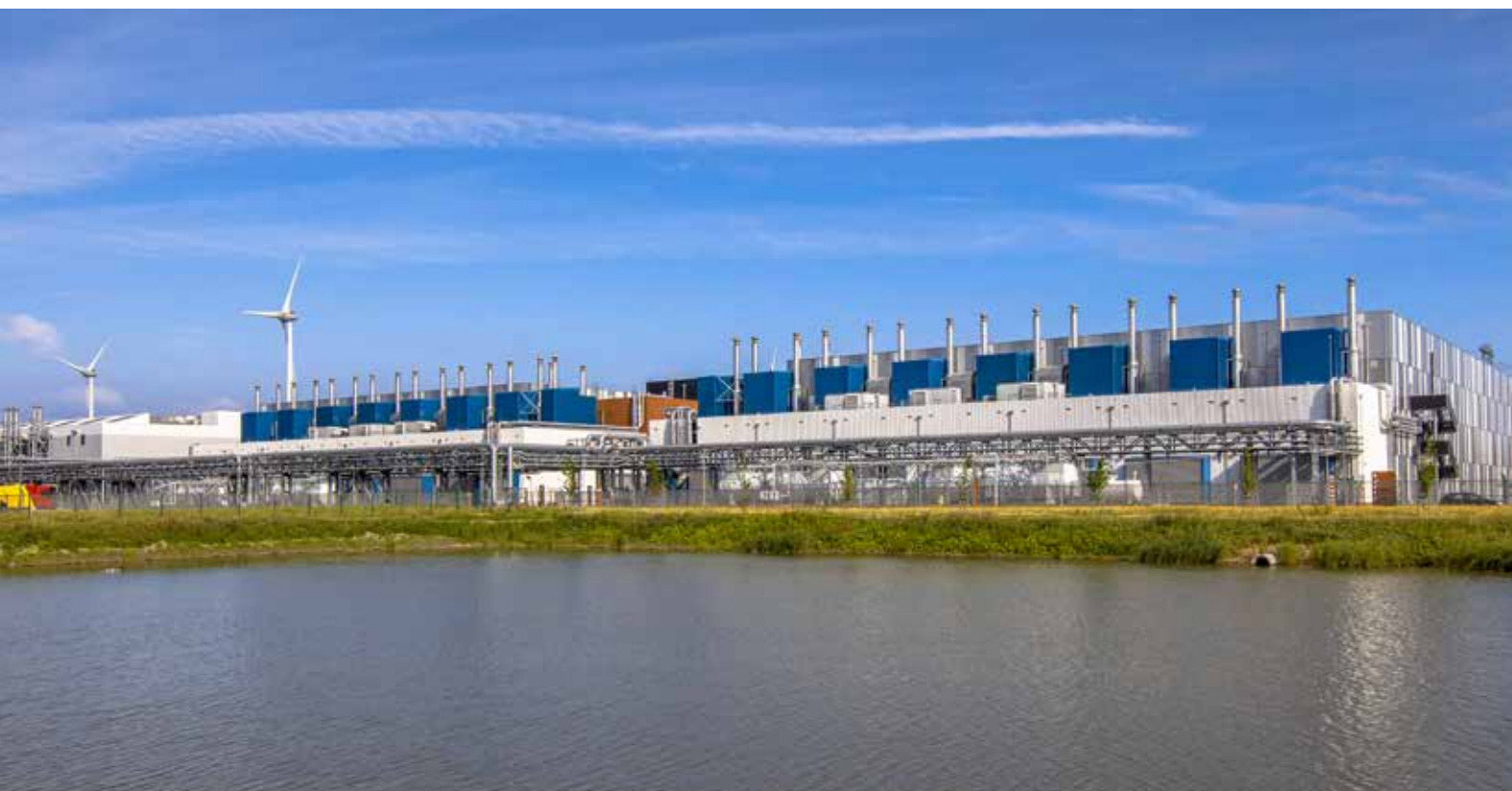
Google datacenter bij de Eemshaven. Deze zal slechts 'in naam' op windenergie kunnen functioneren, niet in realiteit.