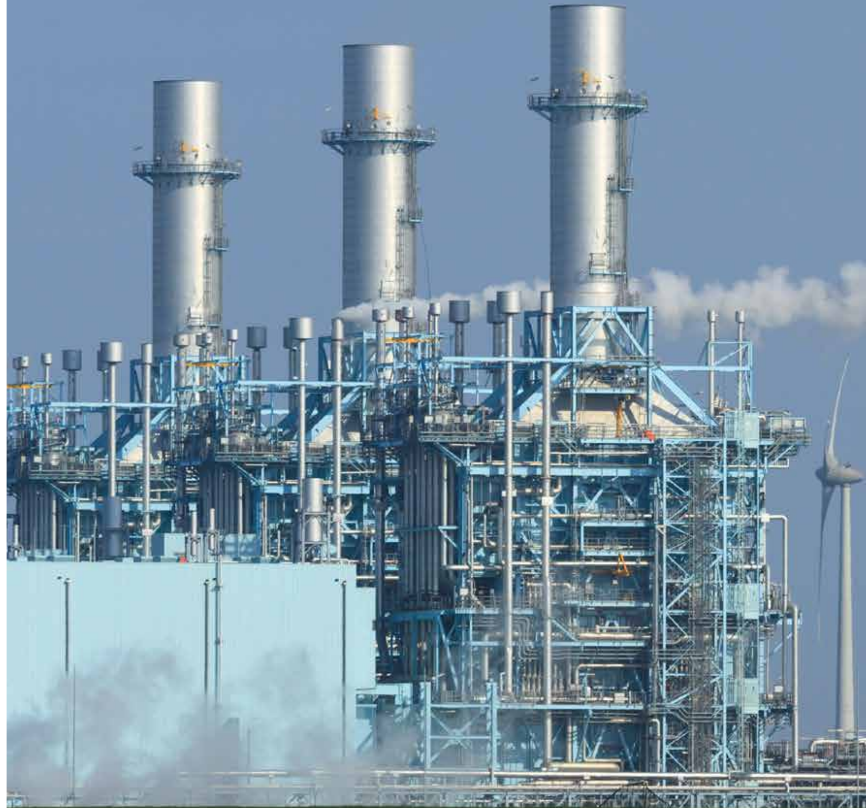
Drie multi-fuel gestookte turbines voor stroomopwekking (energieleverancier RWE) in het Eemshavengebied. Met 3 x 440 MW vermogen, kan deze installatie ruim 10 TWh vraaggestuurde elektriciteit leveren.