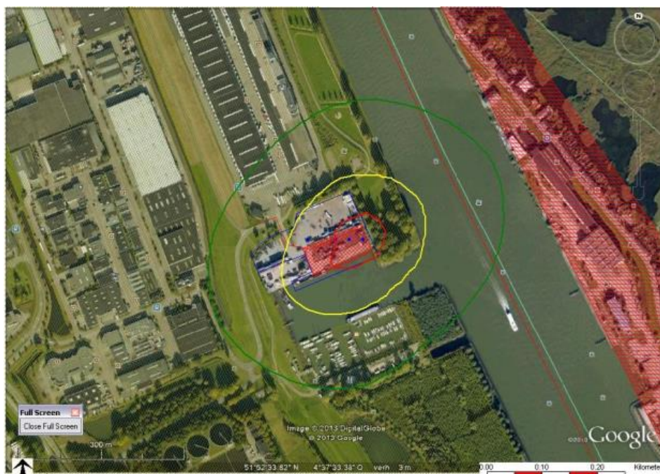
Figuur 2. Plaatsgebonden risico huidige situatie

Figuur 2 toont de plaatsgebonden risicocontouren van de inrichting.