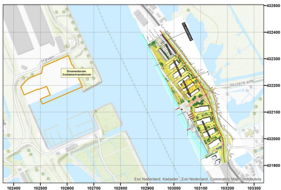
Figuur 1. Groenenboom containertransferium en plangebied

Figuur 1 toont het plangebied en de ligging van Containertransferium Groenenboom.