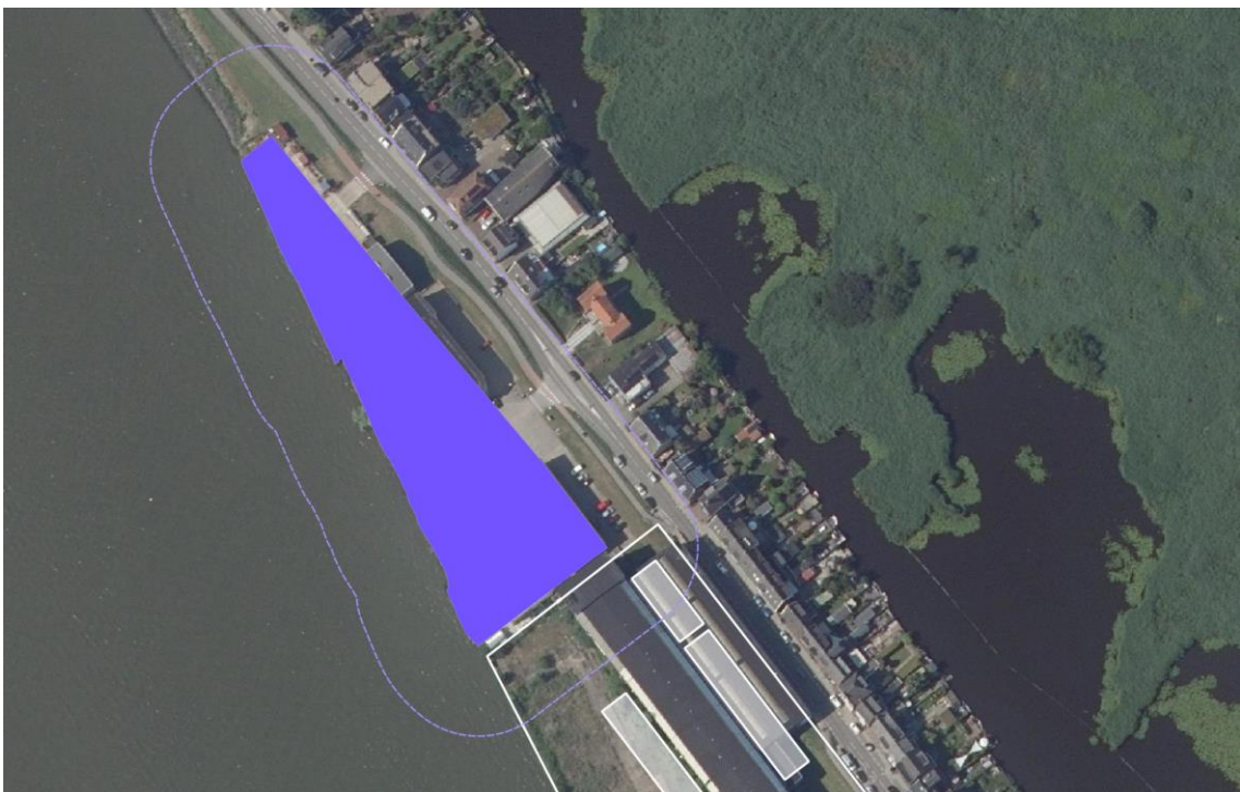
Afbeelding 3: Aanduiding "categorie 3.1" met bijbehorende richtafstanden

Uit de VNG-brochure blijkt dat een bedrijf tot en met milieucategorie 3.1 bij een 'rustige woonwijk' een richtafstand van 50 meter heeft. De omgeving van het plangebied wordt beschouwd als 'gemengd gebied' waardoor de richtafstand gereduceerd wordt tot 30 meter. Zoals op afbeelding 3 te zien is, komt de richtafstand over de geprojecteerde woningen te liggen. Ook hierbij is een nadere afweging noodzakelijk.