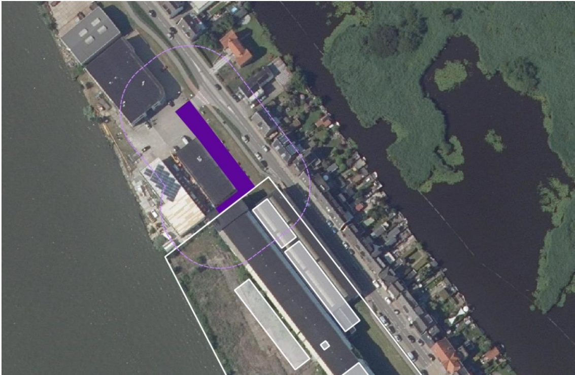
Afbeelding 4: Aanduiding "specifieke vorm van bedrijventerrein - 1" met bijbehorende richtafstanden

Naast de algemene bestemming is ook de specifieke aanduiding "specifieke vorm van bedrijventerrein - 1" opgenomen. Hier is een bedrijfsactiviteit met SBI-code 28.1 uit ten hoogste milieucategorie 3.1 van de Staat van Bedrijfsactiviteiten, zoals bijgevoegd als bijlage 1 van het bestemmingsplan toegestaan. Dit betreft een constructiewerkplaats. De richtafstand bedraagt 30 meter in een 'gemengd gebied'. Zoals op afbeelding 4 te zien is, komt de richtafstand over de geprojecteerde woningen te liggen. Er is derhalve een nadere afweging noodzakelijk.