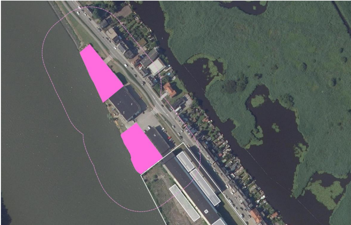
Afbeelding 5: Aanduiding "specifieke vorm van bedrijventerrein - 2" met bijbehorende richtafstanden