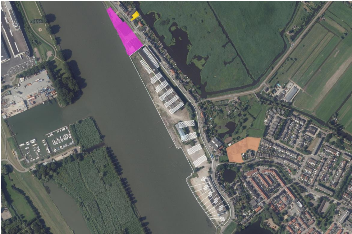
Afbeelding 1: Overzicht van de relevante bedrijven/inrichtingen en bestemmingen.