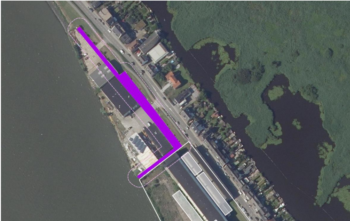
Afbeelding 2: Aanduiding "categorie 2" met bijbehorende richtafstanden