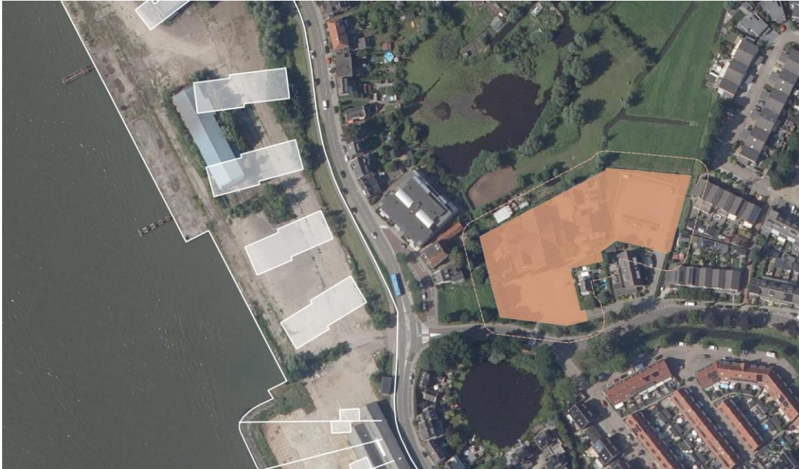
Afbeelding 6: Bestemming ‘Maatschappelijk’ (kerk) met bijbehorende richtafstanden

Ten zuidoosten van de nieuwe woonbebouwing ligt een maatschappelijke bestemming. Binnen deze maatschappelijke bestemming is een kerk aanwezig. In de VNG-brochure heeft een kerk een richtafstand van 30 meter. Gereduceerd levert dit een richtafstand van 10 meter op. Uit afbeelding 7 is op te maken dat binnen deze richtafstand geen gevoelige bebouwing is voorzien. De kerk vormt geen belemmering voor voorgenomen ontwikkeling.