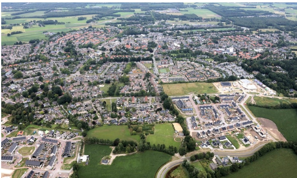
Luchtfoto van Voorthuizen uit juli 2020.

Vergelijk: De Euromast in Rotterdam is 185 m hoog.