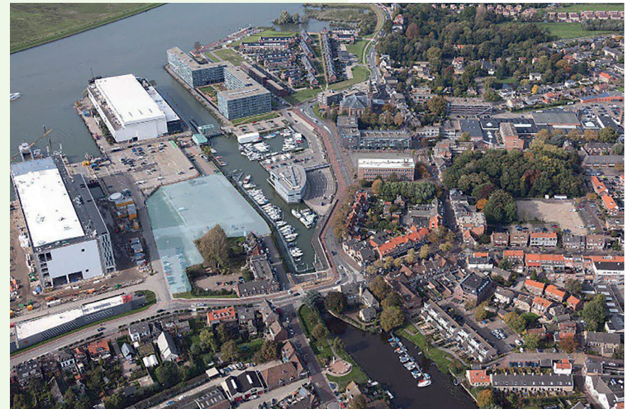
Luchtfoto van Alblasserdam.