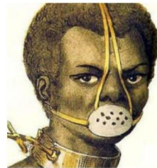
Mondkapjes gedragen vroeger door slaven