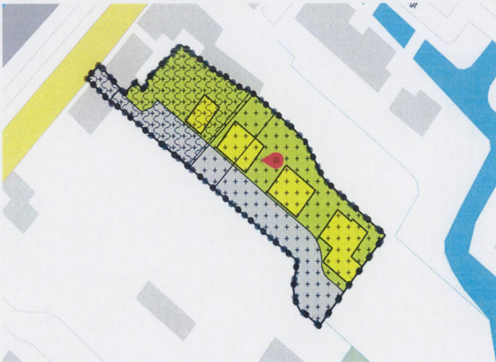
Nieuwe bestemmingsplan Oost Kinderdijk 209 met 6 woningen.