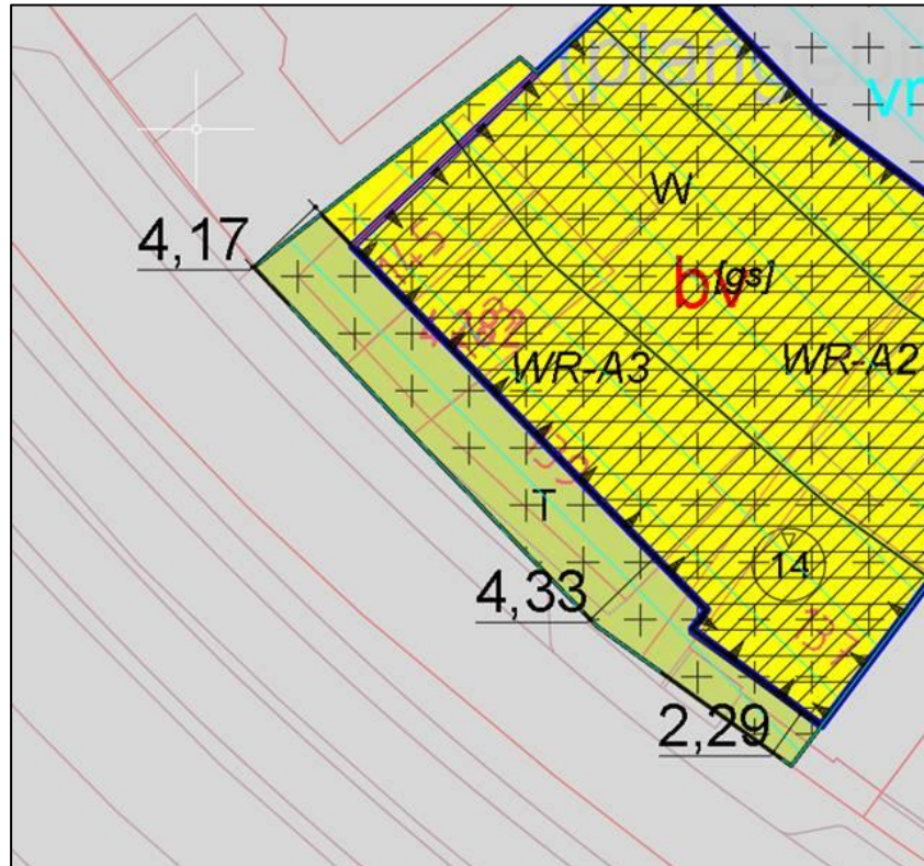
Uitsnede verbeelding ontwerpbestemmingsplan 'Alblasserdam, Oost Kinderdijk 137-145' met daarop de dieptes van de bestemming 'Tuin' weergegeven.

Het bouwvlak van het appartementengebouw wordt verder naar achteren geplaatst dan de huidige bebouwing. Op de verbeelding is dit juridisch vastgelegd doordat er een tuinbestemming van circa 2 tot 4 meter is opgenomen. Deze voor- tuinzone is ook terug te vinden in het bouwplan. Een verdere teruglegging is ruimtelijk gezien niet wenselijk, omdat dit ten koste gaat van de benodigde parkeer- voorzieningen aan de achterzijde van het gebouw. In het vast te stellen bestemmingsplan zullen we de bestemming 'Tuin' aan de westzijde van het plan- gebied van 4,17 naar 4,20 meter verruimen.