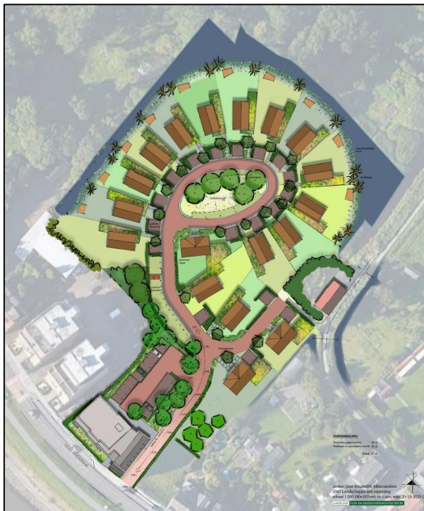
Aangepast ontwerp Oost Kinderdijk 137-145 en 187a.

Een ontsluiting via de Van Hogendorpweg zoals reclamant voorstelt, zou betekenen dat de ontsluitingsweg door het gebied van de Groene Long en/of Huis te Kinderdijk komt te liggen. Dit is wat ons betreft een onwenselijke situatie. Wat betreft de nieuwe uitrit geldt dat tijdens de terinzagelegging van de ontwerpbestemmingsplannen een verdere uitwerking van de bouwplannen aan de Oost Kinderdijk 137-145 en 187a heeft plaatsgevonden. Daarbij is ook gekeken naar een verdere uitwerking van de vormgeving van de ontsluitingsweg. Vanwege het te overbruggen hoogteverschil en het realiseren van een prettige, overzichtelijke en verkeersveilige situatie heeft dit geleid tot een optimalisatie van de vormgeving van de ontsluitingsweg. Navolgende afbeelding laat zien dat de ontsluiting nu meer in een bocht is vormgegeven en iets oostelijker is komen te liggen. De bestemmingsplannen voor Oost Kinderdijk 137-145 en 187a worden op dit punt aangepast.