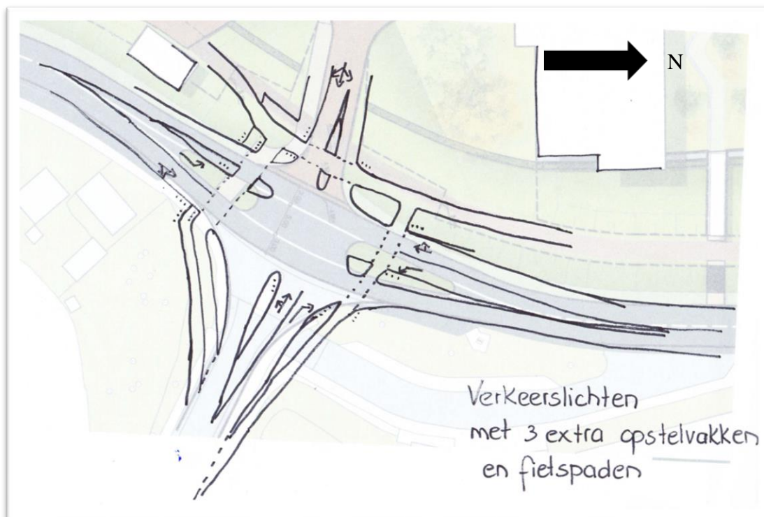
Figuur 4: Verkeerslichten met extra opstelstroken met fietspaden

In figuur 4 is de aansluiting met verkeerslichten en vrijliggende fietspaden weergegeven. Deze oplossing betekent een groot ruimtebeslag. Vraag is of dit qua hellingen mogelijk is.