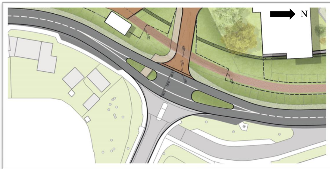
Figuur 1: Voorrangskruispunt brede middenberm

in de middenberm (daarom oranje in tabel 1). De West Kinderdijk noord maakt deel uit van een busroute. Een linksafslaande bus richting Zwarte Paard kan zich niet in een 5m brede middenberm opstellen. Dit kan worden verholpen door op de West Kinderdijk noord een opstelvak te realiseren zodat er een “extra wachtgelegenheid” wordt gecreeërd voor linksafslaand verkeer vanaf West Kinderdijk noord richting Zwarte Paard (figuur 2). Een tweede auto vanuit Kloos kan op de ontsluitingsweg van Kloos wachten en blokkeert daarmee niet het kruispunt. De linksafslaande bewegingen vanaf West Kinderdijk zuid en Zwarte Paard zijn beperkt zodat de kans dat twee wachtende voertuigen op deze richtingen klein is. De verkeersintensiteit linksaf West Kinderdijk – Zwarte Paard ligt hoger. Dit verkeer kan dan op de opstelstrook wachten. Het kruispunt wordt zo niet geblokkeerd.