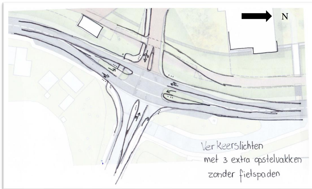
Figuur 3: Verkeerslichten met extra opstelstroken zonder fietspaden

In figuur 4 is de aansluiting met verkeerslichten en vrijliggende fietspaden weergegeven. Deze oplossing betekent een groot ruimtebeslag. Vraag is of dit qua hellingen mogelijk is.