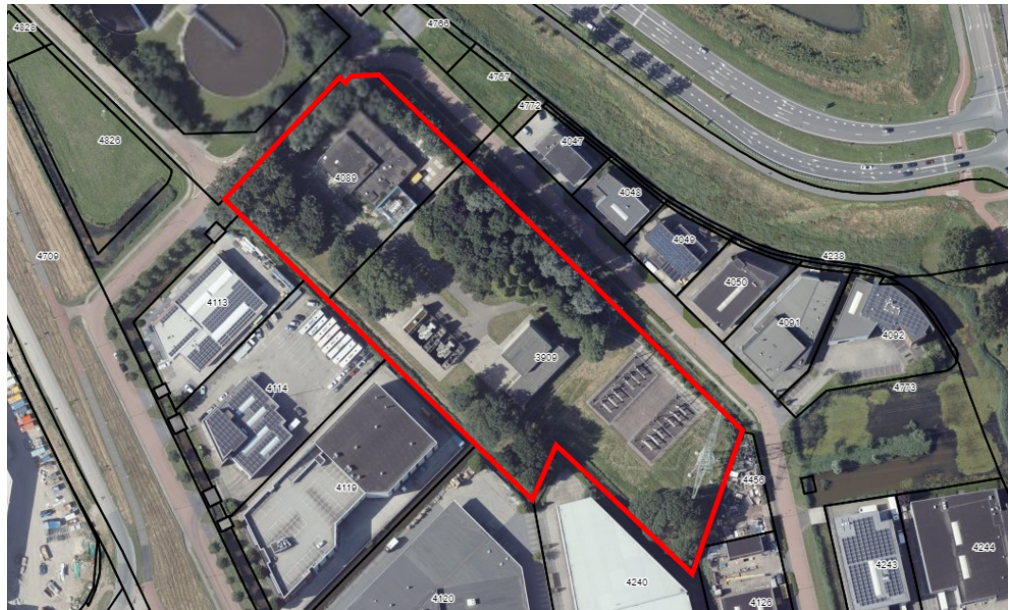
Figuur 1.1: Begrenzing plangebied