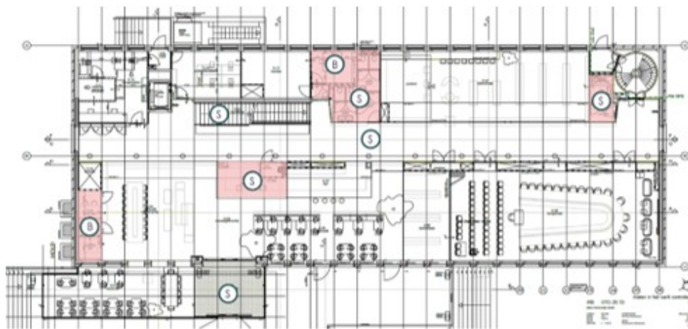
Plattegrond begane grond