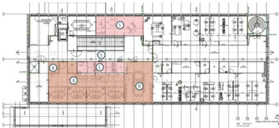
Plattegrond eerste verdieping