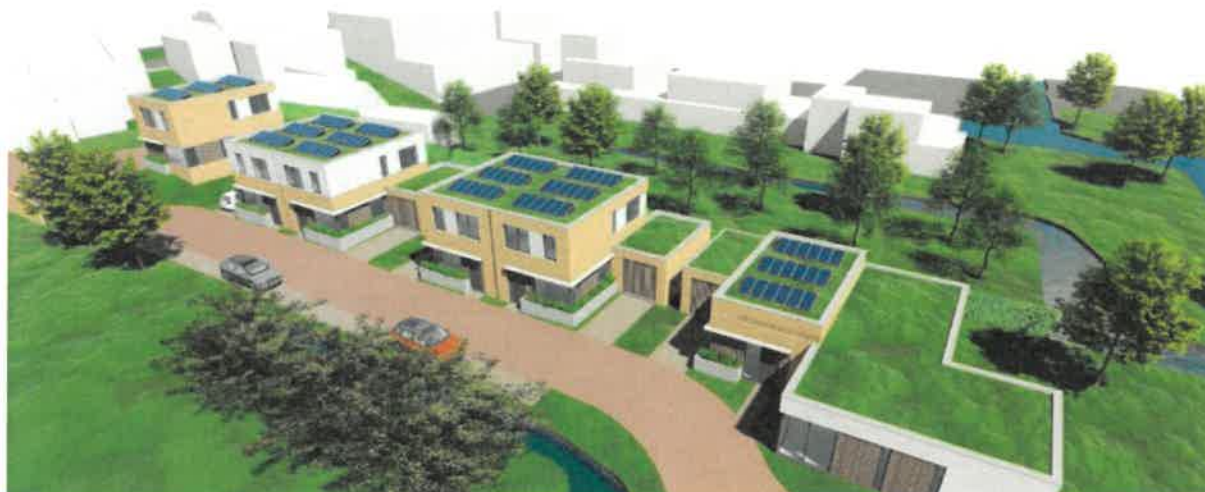
Figuur 2: Impressie beoogde ontwikkeling.

bestemmingsplan omdat op het perceel de bestemming 'Bedrijf' rust. Om de woningen te kunnen realiseren dient het bestemmingsplan te worden herzien.