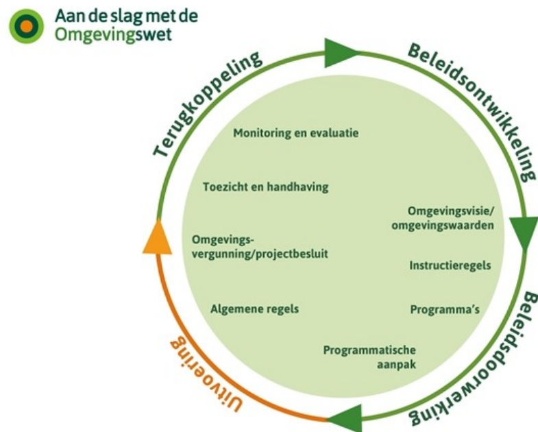
Figuur 4.3. Relatie met andere relevante instrumenten

De signalen uit monitoring en evaluatie kunnen aanleiding zijn voor aanpassing van een omgevingsvisie.