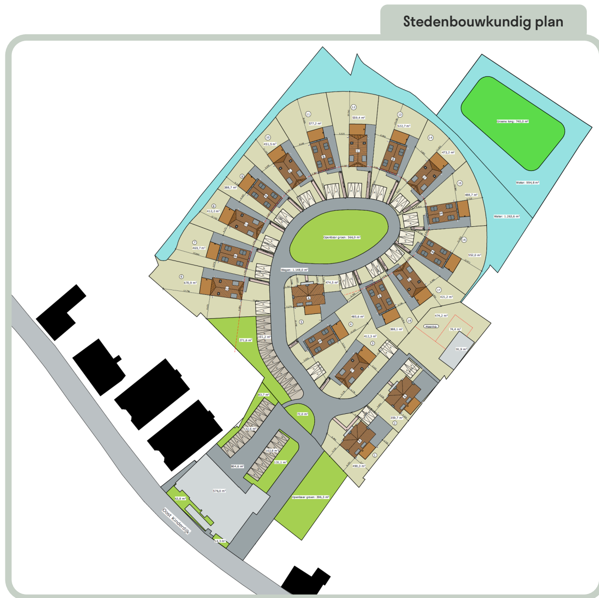
Definitief stedenbouwkundig plan. Bron: EVE Architecten B.V.

Voor de voormalige wasserette aan de Pijlstoep 31 is kwaliteitsverbetering een harde voorwaarde. Zoals eerder vermeld bleken meerdere woningen op deze locatie niet haalbaar. Enkel de bestaande bedrijfswoning in het plangebied blijft behouden en wordt omgezet naar een reguliere burgerwoning met bijbehorende bouw- en gebruiksmogelijkheden. Zo komt er ruimte voor één woning die voldoet aan eigentijdse kwaliteit. De gronden ter plaatse van de voormalige wasserij zullen in de toekomst gebruikt gaan worden als tuin.